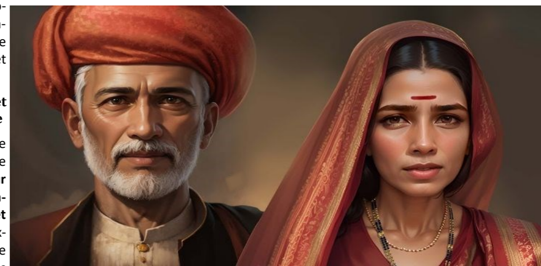
Jyotiba Phule and Savitribai Phule (reconstitution : IA)

Dans un monde encore traversé par les inégalités de genre, de classe et de caste, Savitribai Phule incarne la convergence des luttes : celle de l'accès à l'éducation, de la dignité féminine, et de l'égalité des chances. Elle nous rappelle que l'alphabétisation est un acte politique , et que l'école peut être un lieu de libération.